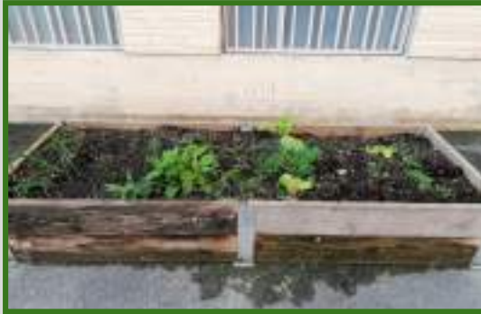
BANCALES DE EDUCACIÓN INFANTIL