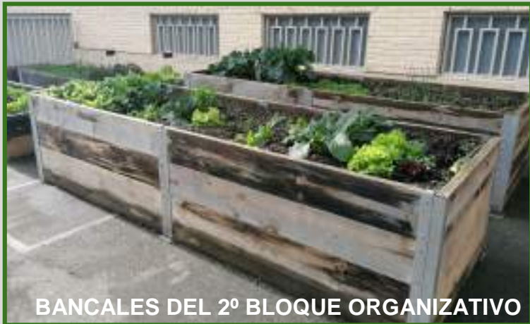
BANCALES DEL 2º BLOQUE ORGANIZATIVO