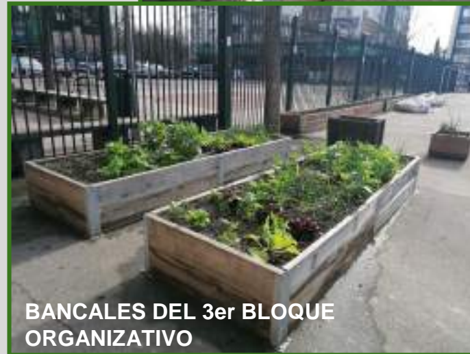
BANCALES DEL 3er BLOQUE ORGANIZATIVO