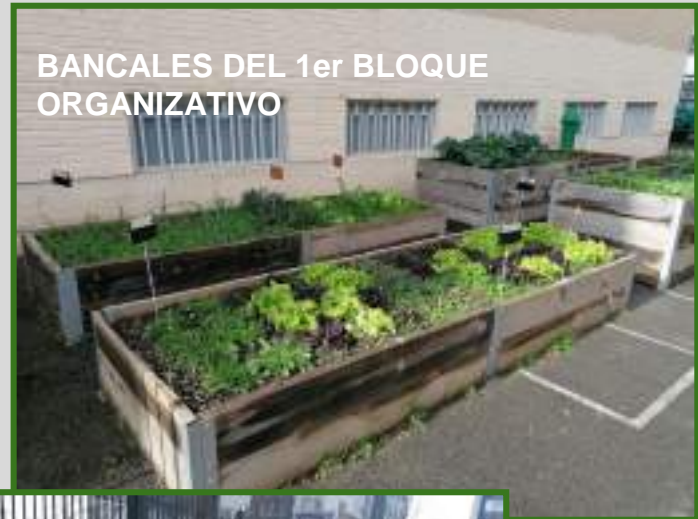
BANCALES DEL 1er BLOQUE ORGANIZATIVO