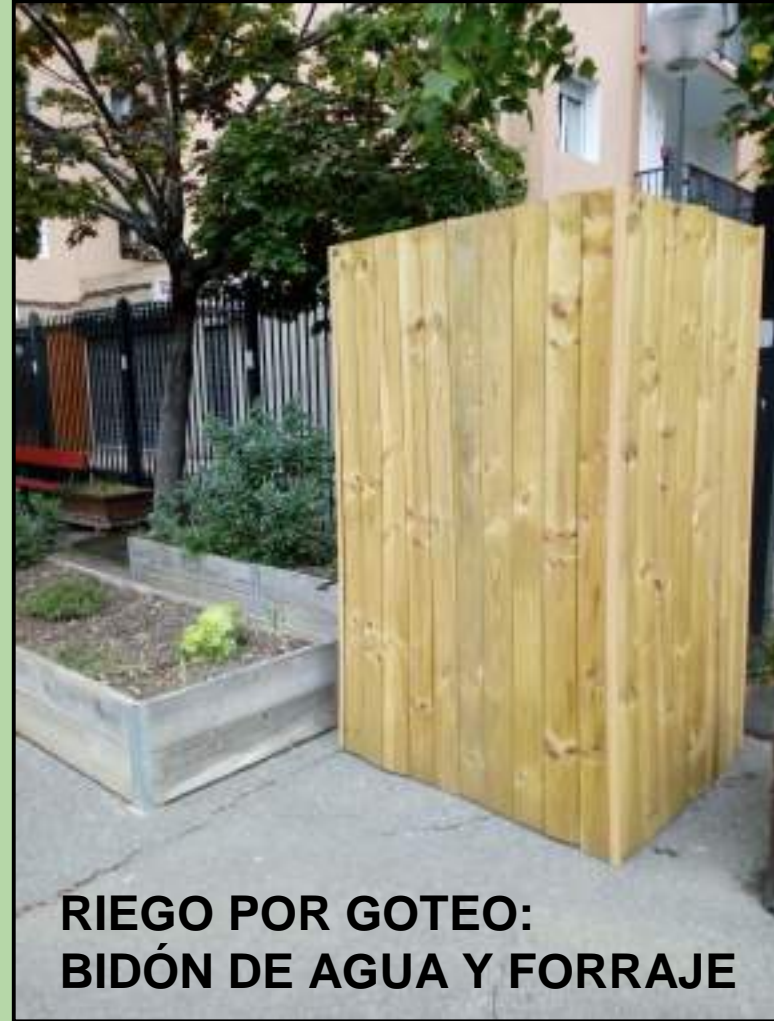
RIEGO POR GOTEO: BIDÓN DE AGUA Y FORRAJE